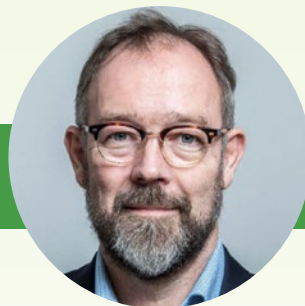
BERND BIEHL Lebensmittel Zeitung