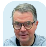
Steffen Fetzner Tischtennis Weltmeister