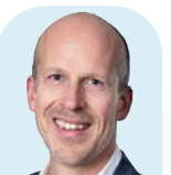
Christian Schmidt GfK