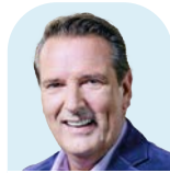
Ralf Dümmel DS Gruppe