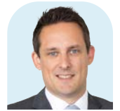
John Grewe Markant Deutsch- land GmbH