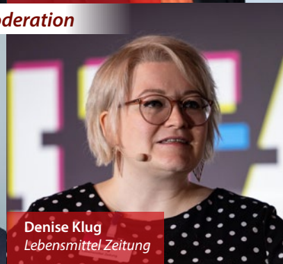
Denise Klug Lebensmittel Zeitung