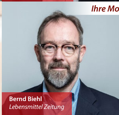
Bernd Biehl Lebensmittel Zeitung