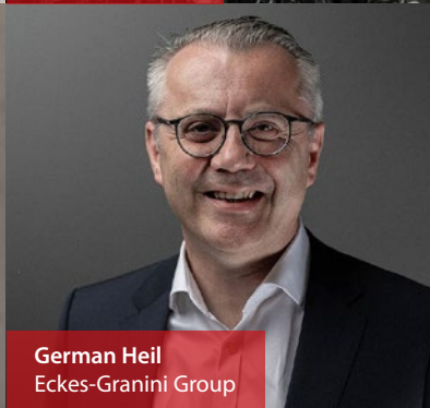
German Heil Eckes-Granini Group