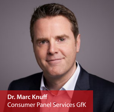
Dr. Marc Knuff Consumer Panel Services GfK